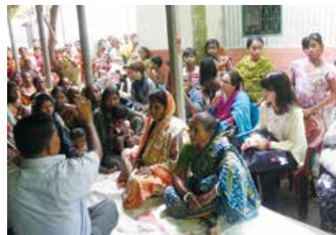
スタディツアーでバングラデシュを訪問（2014年）

センターホームページでは、活動の報告と公開イベントのご案内も掲載していますので、是非一度ご覧ください。