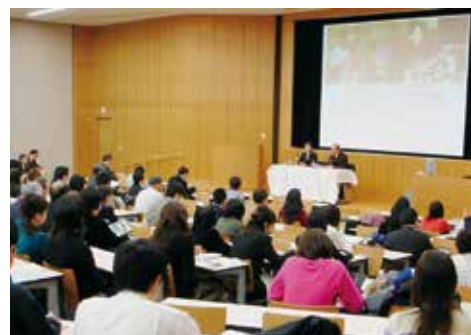
マグサイサイ賞受賞のプラティープ氏の講演（2005年）

平和に関心を向ける研究機関の存在は多数ではないが、複数の大学の機関がそれぞれ刮目すべき活動をすすめている。今後はお互いが連携して、より生産的な成果を生み出すことを期待したい。その意味でも、今回、平・コミの紹介に紙幅をいただいたことに謝意を呈する。