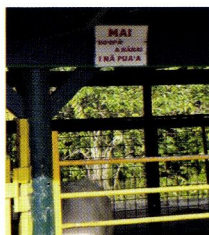
写真②豚小屋「豚に触ったり餌を与えないでください」と表示

授業外で特に印象的だったのは、校舎の裏手に大きな庭園、農場、イム(ハワイ式の大きな囲炉裏: 写真①)、豚小屋(写真②)があったことです。管理責任者の方、同校出身のホスト大学生の案内によれば、この学校では言葉を教育するだけでなく、昔のハワイ人たちの生活様式やそこに投影される社会文化的な価値観も教育を通して受け継いでいくことを大事にしているということでした。日本での「いのちの教育」ではありませんが、年に1度は飼育した豚をさばいたのち、イムで料理し、ハワイ式のパーティ「ルアウ」も開催されるとのことです。「言語は話者や民族のアイデンティティだと認識し、尊重すること」や「ことばにこめられている社会文化的な価値観を世代を超えてどのように継承していくか」は、言語が言語として生き抜いていくために非常に大切なことです。この側面を生活行動の教育を通してまさに「イマージョン」していることに非常に感銘を受けました。