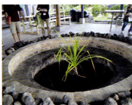
写真①イム: 非常に大きく、大人数分の料理にも対応

私は2011年2月にハワイ大学マノア校(オアフ島)で開催されたInternational Conference on Language Documentation and Conservationという学会に参加しました。その学会のプログラムの一部で、ハワイ大学ヒロ校(ハワイ)がホストとなり、同じハワイ島にあるNawahokalaniōpūという幼稚園から高校までハワイ語のイマージョン教育を行っている学校を見学する機会を得ました。授業見学では、小学校低学年の子どもたちが私たちにゲストにも分かるレベルのハワイ語で「自分の名前・自分の住んでいる場所」をハワイ語で自己紹介してくれました。中学生の授業ではハワイ語でアメリカ文学史のイントロレベルを学んでいます。